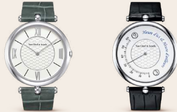
Pierre Arpels, 38 mm Bracelet or pavé